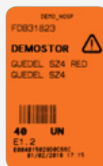
Card RFID portocaliu Comandă urgentă

Implementarea acestui proces de management la punctele de consum ale unităților medicale, permite spitalului să-și optimizeze capacitățile de stocare, să aplice principiul FIFO pentru utilizarea stocurilor învechite și să atingă obiectivul "comanda este egală consumului".