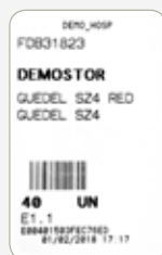
Card RFID alb Comandă standard

Sistemul Dyane SmartKanban® se bazează pe utilizarea cardurilor RFID amplasate în coșurile rafturilor modulare din magazinele spitalelor, administrate conform principiului Kanban. Acesta utilizează un sistem cu două compartimente, pentru a indica nevoia reprovizionării cu materialele și urgența înlocuirii acestora. Primul (cardul alb / comandă normală) iar al doilea (cardul portocaliu / comandă de urgență).®